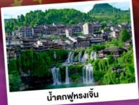
น้ำตกฟูหลงเจิ่น

เที่ยวชมหมู่บ้านโบราณริมน้ำตก "ฟูหลงเจิ่น" นั่งกระเช้าขึ้นสู่อุทยาน กูเขาเจ็ดดาว