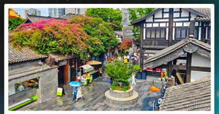
ถนนชอยกวางชอยแคว