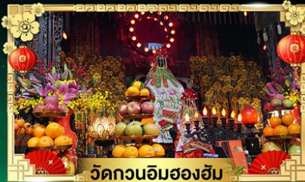
วัดกวนอิมสองอิม