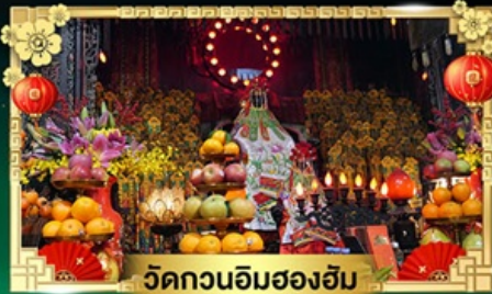
วัดกวนอิมสองฮับ