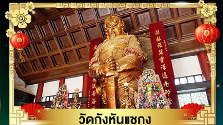
วัดกังหันแซง