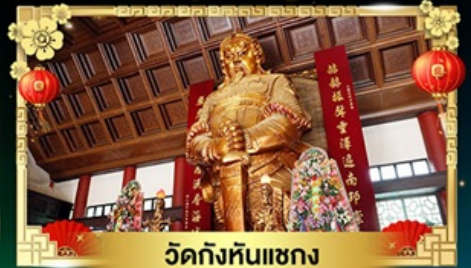
วัดกั๊งหันแซง