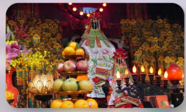
วัดกวนอิมสองฮิม