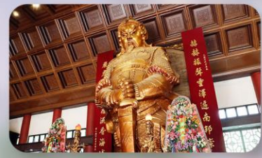
วัดกังหันแซง