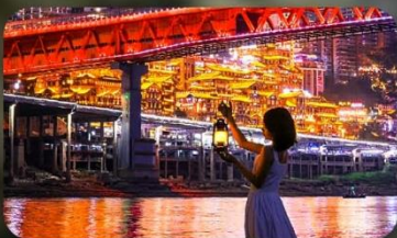
สวนริมแม่น้ำแกรนด์เธียร์เตอร์