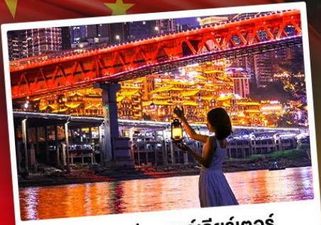
สวนริมน้ำแกรนด์เธียร์เตอร์

จากเจียงเจ็ย + ฉงชิ่ง เที่ยวคุ้ม! เมืองสวยธรรมชาติอลังการ