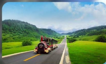
เจนางฟ้า