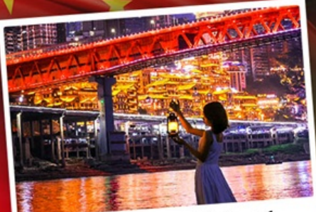
สวนริมน้ำแอมแกรนด์เธียร์เตอร์