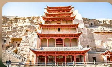
ถ้ำม่อเกาถู