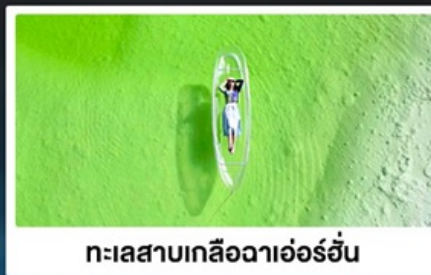
ทะเลสาบเกลือฉาเอ๋อร์อัน