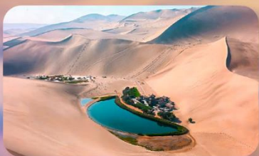
เบนทรายหมิงซาซาน