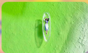
ทะเลสาบเกลือฉาเอ๋อร์ซัน