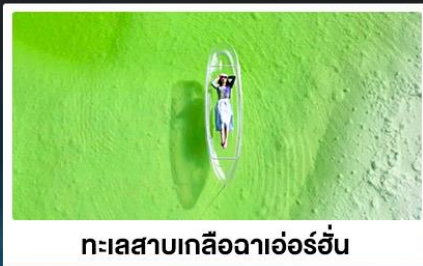
ทะเลสาบเกลือฉาเอ๋อร์ฮั่น