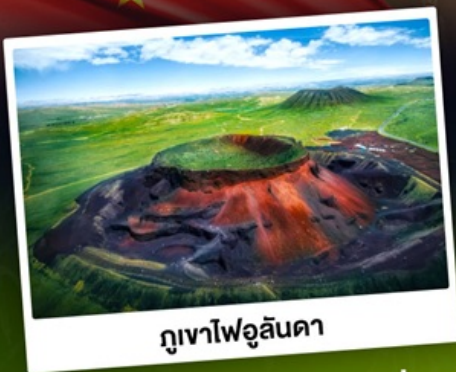
ภูเขาไฟอูลันคา

ท่องดินแดนแห่งทะเลทรายและทุ่งหญ้า ชมพระอาทิตย์ขึ้นทุ่งหญ้าออร์ดอส