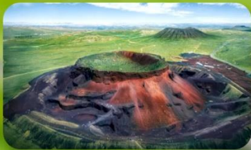
ภูเขาไฟอูลันดา