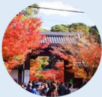
จุดประตูไซมง เป็นประตูทางเข้าหลักของวัดเอคันโด

นำท่านเดินทางสู่ เกียวโต เป็นเมืองที่ได้ชื่อว่าเมืองแห่งศิลปะและวัฒนธรรมของญี่ปุ่นอย่างแท้จริง จากนั้นนำท่านเยี่ยมชม วัดเอคันโด (Eikan-do) วัดสวยที่มีชื่อเรียกขานถึง 3 ชื่อ ไม่ว่าจะเป็น เซนรินจิ, โซจูโรงะซัง หรือ มูเรียวจูอิน วัดนี้ตั้งอยู่บริเวณปลายสุดทางทิศใต้ของ "ทางเดินนักปราชญ์" ในย่านฮิงาชิยามะ โดดเด่นด้วยอาคารไม้โบราณที่เชื่อมถึงกันด้วยทางเดินมีหลังคาคลุมลัดเลาะไปตามสวน วัดเอคันโด มีประวัติศาสตร์ยาวนานตั้งแต่สมัยเฮอัน โดยเริ่มจากขุนนางระดับสูงได้มอบพื้นที่แห่งนี้ให้เป็นที่พำนักของพระสงฆ์ ภายในวัดเต็มไปด้วยงานศิลปะที่ทรงคุณค่า โดยเฉพาะ รูปปั้นพระอมิตาพุทธ ที่มีเอกลักษณ์ไม่เหมือนใคร เพราะพระเศียรจะหันไปทางด้านข้าง ซึ่งมีตำนานเล่าว่า พระองค์เคยหันมาพูดคุยกับเจ้าอาวาสนั่นเอง นอกจากนี้ ที่นี่ยังเป็น "แลนด์มาร์ค" อันดับหนึ่งสำหรับการชมใบไม้เปลี่ยนสีในช่วงปลายเดือน พฤศจิกายน ซึ่งจะสวยงามเป็นพิเศษทำให้บรรยากาศดูราวกับอยู่ในเทพนิยาย ภายในวัดมีมุมถ่ายรูปเก๋ๆ กับใบไม้แดงเพียบ