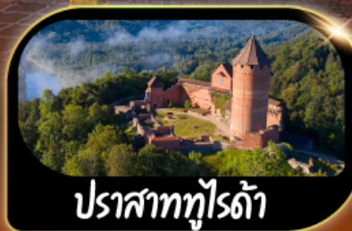
ปราสาททุไรดำ

GO3HEL-EK001 28 ธ.ค.69 - 07 ม.ค.70 เทศกาลปีใหม่