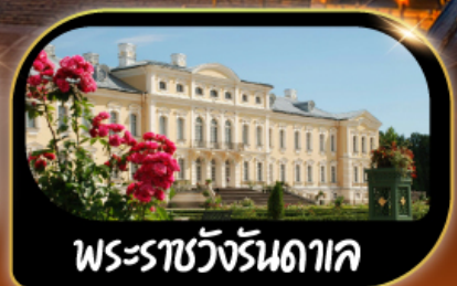
พระราชวังรันดาค