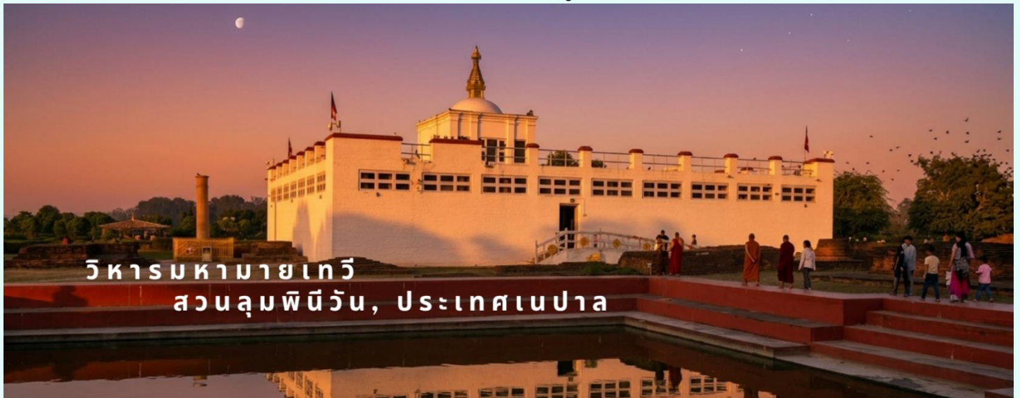
วิหารมหายาเทวี สวนลุมพินีวัน, ประเทศเนปาล

ด้านในวิหารมหายาเทวีไม่อนุญาตให้บันทึกภาพ แต่โดยรอบสวนลุมพินีวัน สามารถถ่ายรูปได้ โดยมีค่าธรรมเนียมกล้องดังนี้ กล้องถ่ายรูปธรรมดา ไม่เสีย กล้องวีดีโอ 10 USD / 800 รูปีอินเดีย / 400 บาท