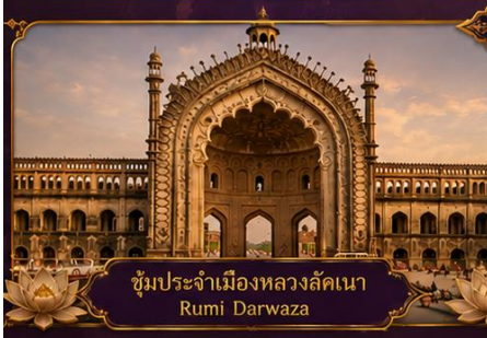
ซุ้มประจำเมืองหลวงลัคเนา Rumi Darwaza

พร้อมชมสิ่งมหัศจรรย์อินเดียในทริป 9 วัน 7 คืน