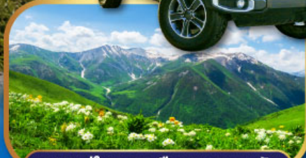
4WD สู่ใจกลางเทือกเขาคอเคซัส