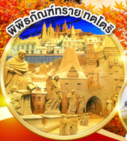
พิพิธภัณฑ์รายกตไตร