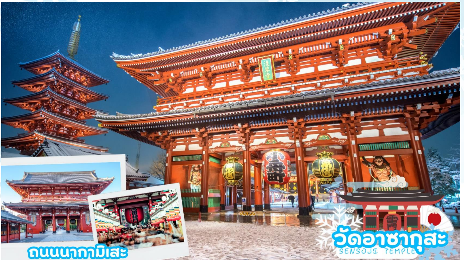
ถนนนากามิसे