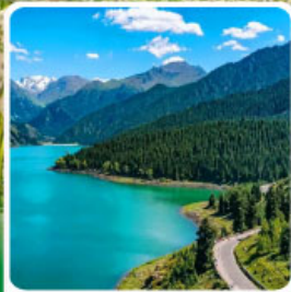
อุทยานเทียนซาน เทียนนือ