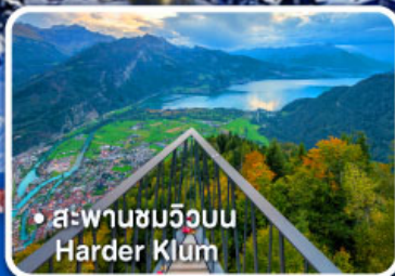
• สะพานชมวิวยอบบ Harder Klum