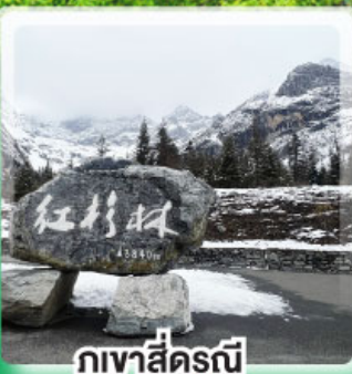
ภูเขาสี่ฤดู