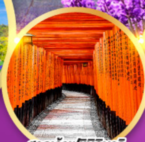
ศาลเจ้าฟุชิมิอันาริ