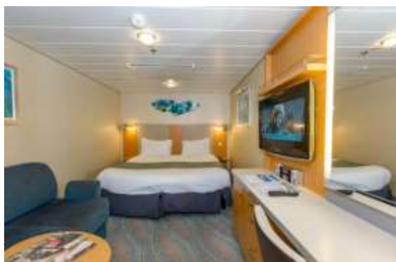
OCEAN VIEW CABIN