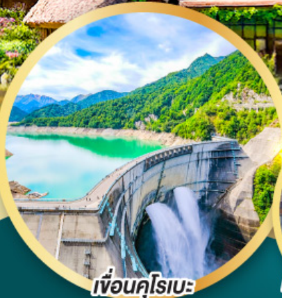
เพื่อนคู่โรเบะ