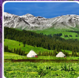
ทุ่งหญ้านาฬิกา