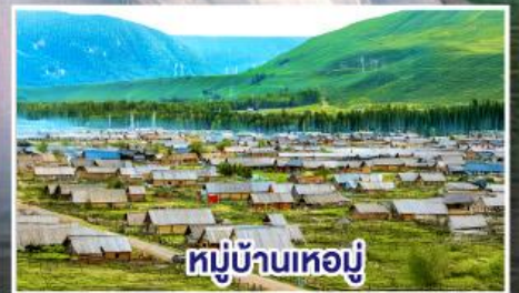
หมู่บ้านทอผ้า