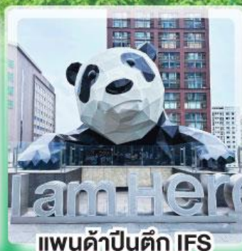
แพนด้าปิ่นตัก IFS