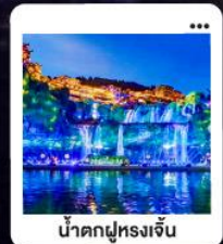
น้ำตกฝูหลงจิ้น

"มหัศจรรย์...จางเจียเจีย" | ดินแดนแห่งขุนเขาและสายน้ำ "เขาเกียนเหมินซาน" | ประตูดวง...ท่าอากาศยาน 999 ชั้น | นั่งรถไฟความเร็วสูง สัมผัสความสวยงามระบียงแก้ว "อุทยานอวตาร" | ส่องลอยกลางขุนเขา...ดั่งภาพฝันในห้วงนเจียเจีย | ซุปปิ้ง POPMART "เมืองโบราณ"ฝูหลง" หยุตเวลา ณ เมืองบนม่านน้ำตก... | "เฟิ่งหวง" ล่องเรือชมชีวิตริมแม่น้ำทิวเจียง "นครฉางซา" ปิดท้ายความทันสมัย