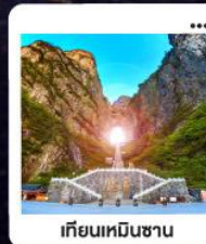
เกียนเหมินซาน