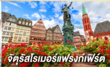
จัตุรัสโรเมอร์เฟรงก์เฟิร์ต