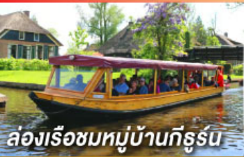
ล่องเรือชมหมู่บ้านกังหัน