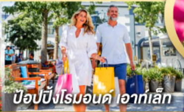
ป๊อปบิงโรมอนด์ ไอท์เล็ก