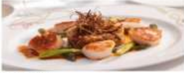
Main Dining Disney's Rotational Dining lets you "rotate" to one of 3 restaurants, while your servers follow you from venue to venue. View More