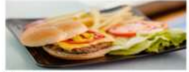
Casual Dining Savor a wide range of fresh food items and mouthwatering delicacies for dinner. View More