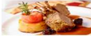
Adult-Exclusive Dining Enjoy romantic dinner destinations that cater exclusively to adults looking for fine dining amid an elegant atmosphere. View More