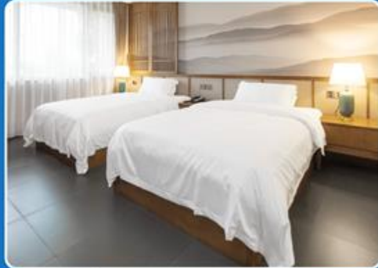
👤👤 TWIN (TWN)