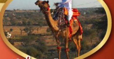
ฟรี ขี่อูฐ เมืองมันทอวา ราคาเริ่มต้น