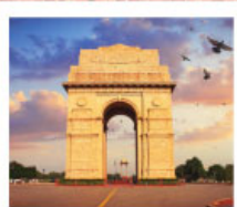
♡♡♡ India Gate