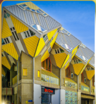
บ้านลูกเต๋า โคกคูนุส

“ล่องเรือหลังคากระจก” ชมกรุงอัมสเตอร์ดัม