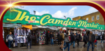
ตลาดแคมเดน