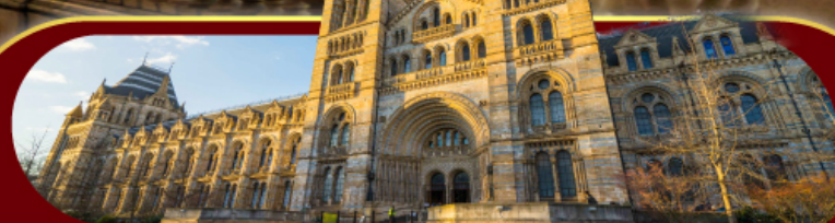
พิพิธภัณฑ์ประวัติศาสตร์โลกทางธรรมชาติ