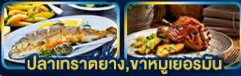
ปลาเทราต์ย่าง, จาห์มูเยอรมัน

Season of romance. Germany Austria Czech Slovenia Hungary