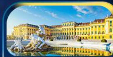
พระราชวังเชินบรุนน์