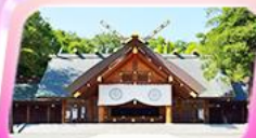
ศาลเจ้าซอกโทโด

เอาใจชาว Flower Lover ฟาร์มดอกลาเวนเดอร์ โทมิตะฟาร์ม จุดยอดฮิตห้ามพลาด คลองสายวัฒนธรรมโอตารุ เครื่องแก้วโอตารุ พิพิธภัณฑ์กล่องดนตรี เป็นพระพุทธรเจ้า ขอพรศาลเจ้าออกโทโด มหัศจรรย์บ่อน้ำสีฟ้า ทะลุโรงงานซ็อกโกแลตชิโรอิโคอิบิโตะชื่อดัง