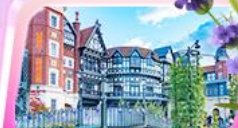
โรงงานซ็อกโกแลต