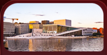
OSLO OPERA HOUSE