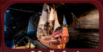
พิพิธภัณฑ์วีกา