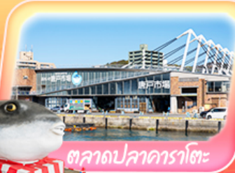
ตลาดปลาอาราโตะ

ถ่ายภาพปราสาทโคคุระ ช้อปบิงจูจี้ที่ เอาเก้เล็คคิตะคิซุ