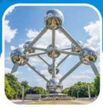
ช้อปปิ้ง มหานครปารีส

ล่องเรือชมแม่น้ำไรน์ เมือง เซนต์กอร์ - บ็อบพาร์ท ชมเมือง โคโลญ มหาวิหารโคโลญ เที่ยวเมือง กิ์รูน ล่องเรือ ชมหมู่บ้าน ชมเมืองไวเลนดัม ซานสคัน อัมเตอร์ดัม เมืองหลวง เนเธอร์แลนด์ ล่องเรือหลังคากระฉก ชมสถาบันเพชร ล่องเรือชมเมืองเก่าบรูจจ์ บรัสเซลส์ ชมอะตอมเมียม เข้าสู่ปารีส เข้าพระราชวังแวร์ซายส์ อิสระช้อปปิ้ง ล่องเรือแม่น้ำแซนนด์