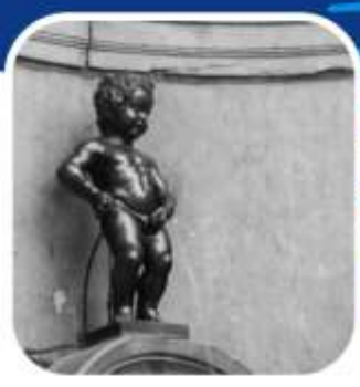
โรงแรมที่พัก 4 ดาว