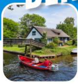
ท่องเที่ยวครบ ตลอดการเดินทาง