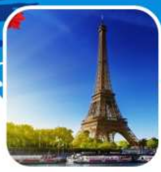
อาหารพิเศษเมนู พื้นเมือง