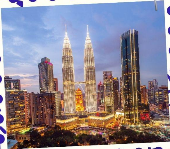
Petronas Twin Towers