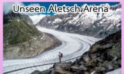
Unseen Aletsch Arena

ชมความงดงามของทะเลสาบเจนีวา ชมปราสาทชิลองที่เมืองมอว์คเทอซ ล่องเรือชมความงามของทะเลสาบ ลูเซิร์น, พักในหมู่บ้านเซอร์แมท (เมืองตากอากาศปลอดมลพิษ ที่ได้ ชื่อว่าสวยงามเหมือนสวรรค์บนดิน)