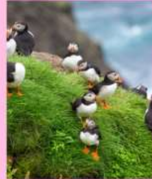
สัมผัสดินแดนไวคิงชม พระอาทิตย์เที่ยงคืน

*** เส้นทางท่องเที่ยวสุดอันซีน เกาะแฟโร-เกาะกรีนแลนด์ สองดินแดนแสนสวย ที่เราอย่างให้ทุกท่านได้ไปสัมผัสสักครั้งในชีวิต "เราจัดรายการทัวร์แบบหลวมๆ สบายๆ เพื่อให้ท่านได้ท่องเที่ยวแบบไม่เร่งรีบ