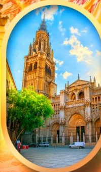
มหาวิหารโตเลโด