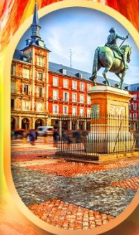
พลาซามายอร์