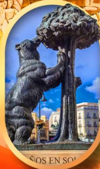
อนุสาวรีย์หมี