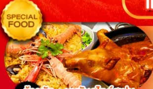
ข้าวมัน+หมูหันสไตล์สเปน