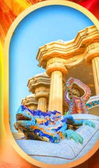
ปาร์ค กูเอล