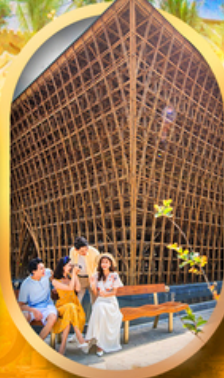
อาคารไม้ไผ่