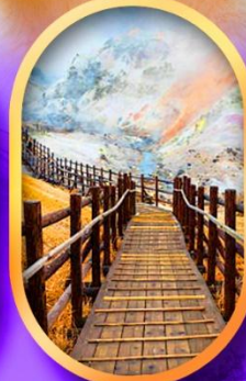
หุบเขานรกจิงคุดานิ