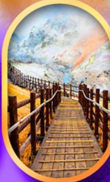
จิกอคุนิ