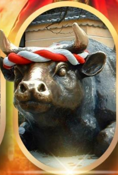
ศาลเจ้าดาไซฟุ