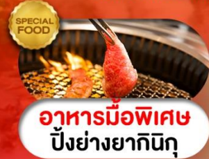
อาหารมือพิเศษ ปิ้งย่างยากินิกุ