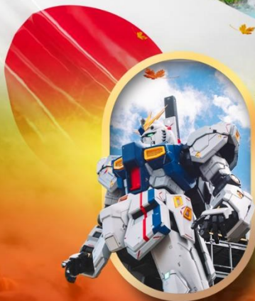
ห้างลาลาพอกันดั้ม