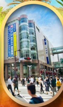
ช้อปปิ้งย่านเท็นจิน