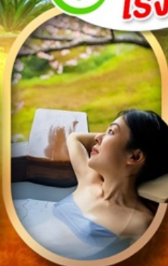
แช่ออนเซ็นญี่ปุ่น