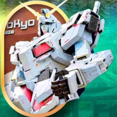
ห้างไอโดะกันดั้ม