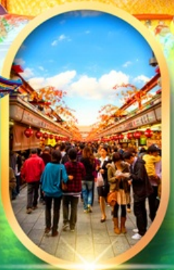
ถนนนากามิเสะ