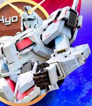
ห้างไอโดปะกันดั้ม