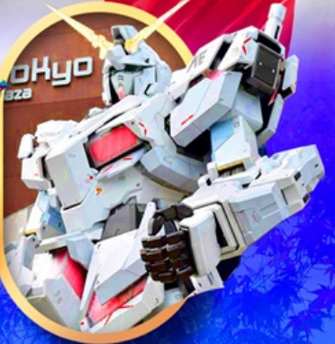
ห้างไอโดบะกันดั้ม