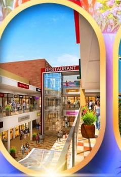
มิตซูยาเออากิเอ็ต