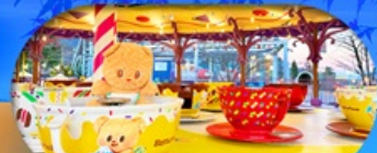
Fuji q Highland x Butterbear เดินทาง พ.ศ. 69 เป็นต้นไป