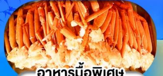
อาหารมือพิเศษ บุฟเฟ่ต์งาปู