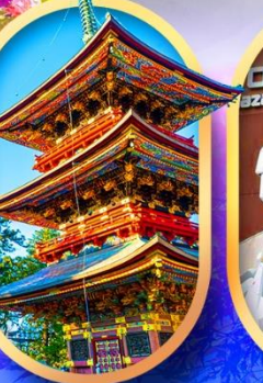
วัดนาริตะ-ซัน