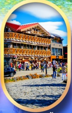
ภูเขาไฟฟูจิ ชั้น 5