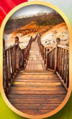
หุบเขาจิกอกุคาบิ