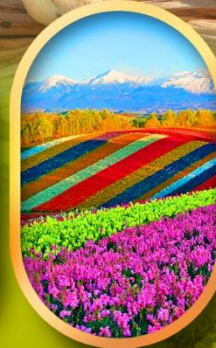
สวนดอกไม้ซิกิไซ