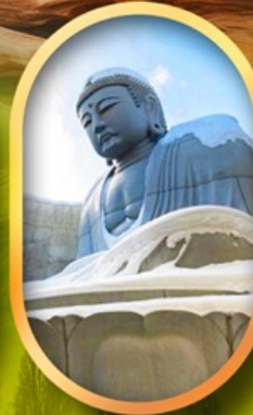
เนินเขาแห่งพระพุทธรเจ้า