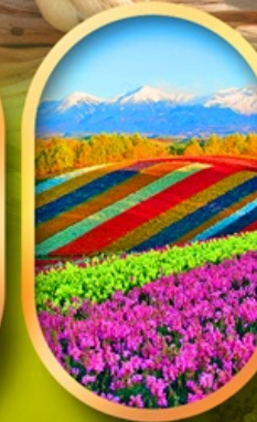
สวนดอกไม้ชิชิโกะ