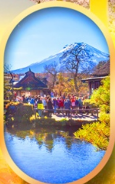
หมู่บ้านน้ำใส