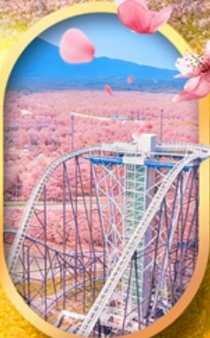
ฟูจิยาม่า ทาวเวอร์