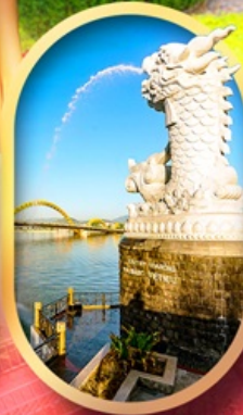
คาร์พดราทอน