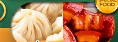
พิเศษ เสี่ยวหลงเปา หมูตงฟอ เดินทาง ม.ค. - มิ.ย. 69